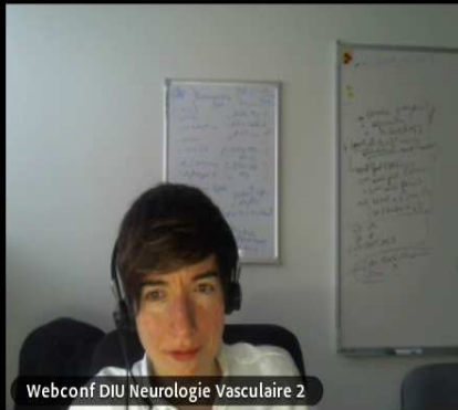
Webconf DIU Neurologie Vasculaire 2